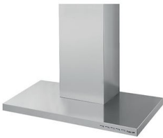
Cappa d'aspirazione KS Lux 2504 094